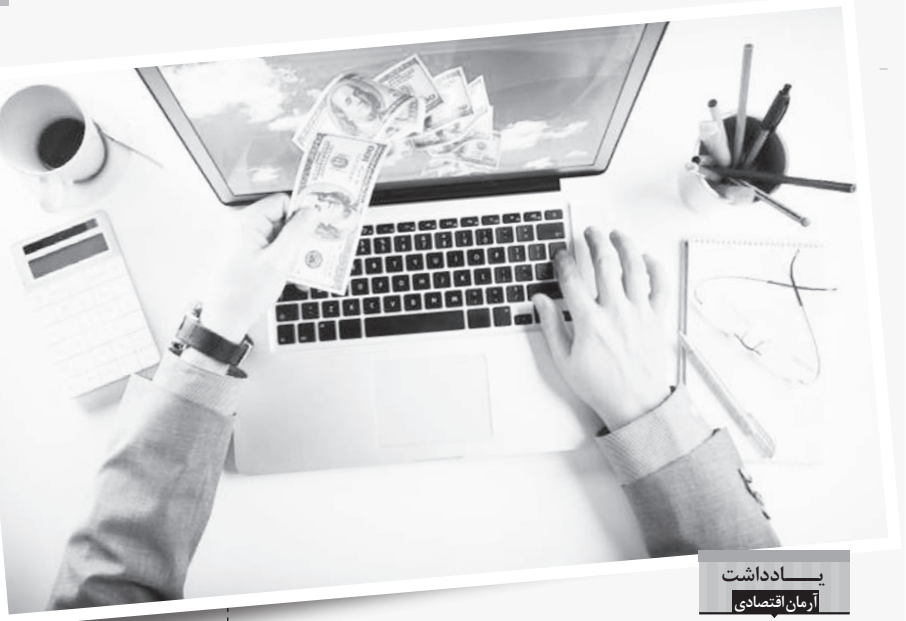
یادداشت ازمان اقتصادی

کارشناسان می گویند، شرط ورود کسب و کارهای اینترنتی به بورس شفافیت مالی است. وقتی حتی بانک های ایران دفاتر شفافیتی ندارند، کسب و کارهای اینترنتی هرگز خود را در معرض داوری دولت قرار نمی دهند.